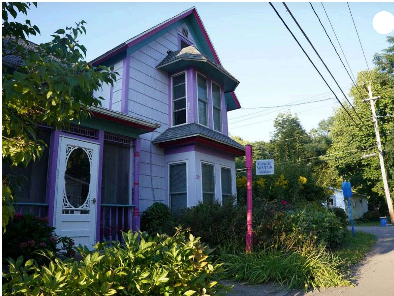
Casa de una médium en Lily Dale.