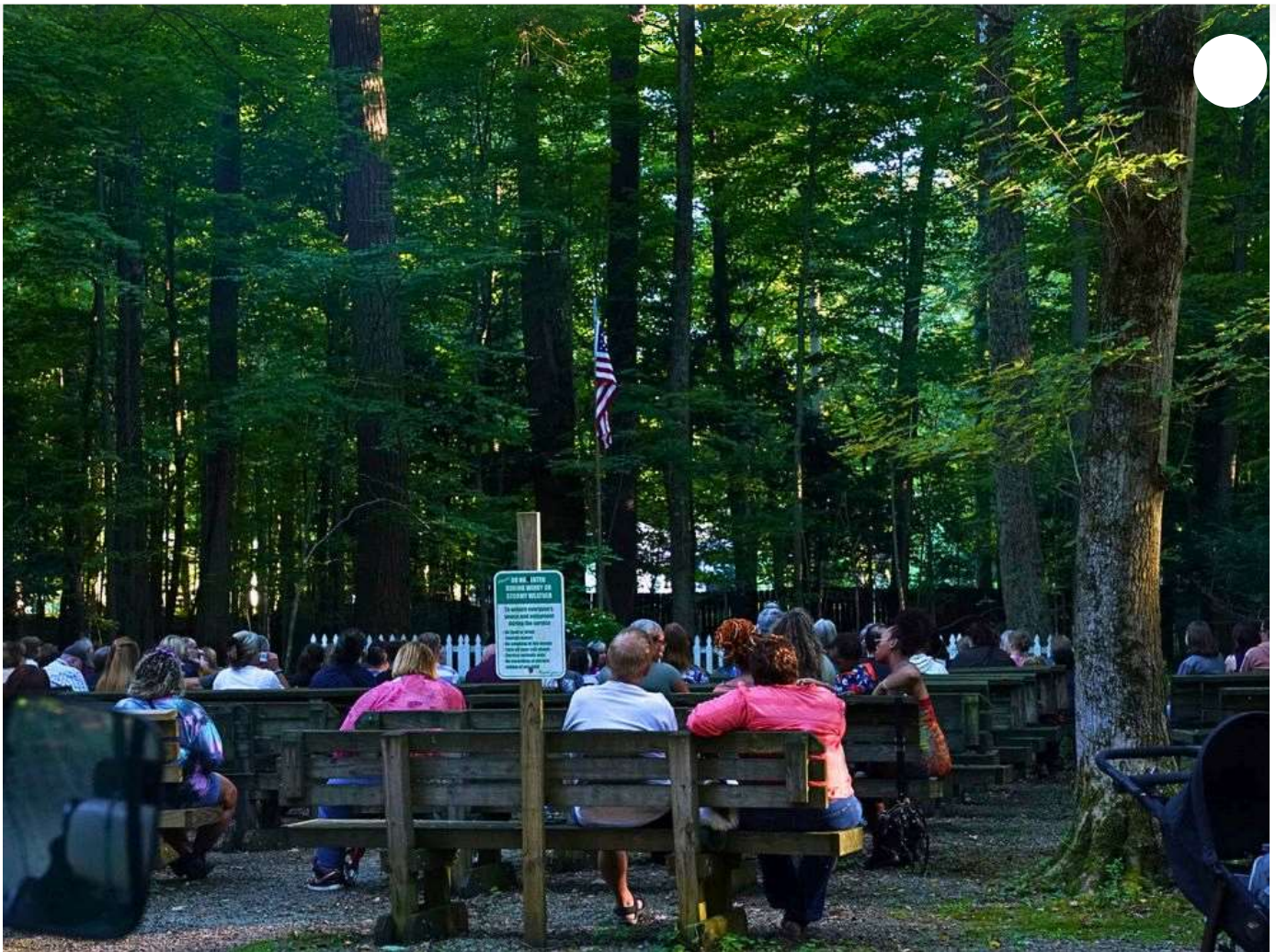
Tocón de la inspiración.