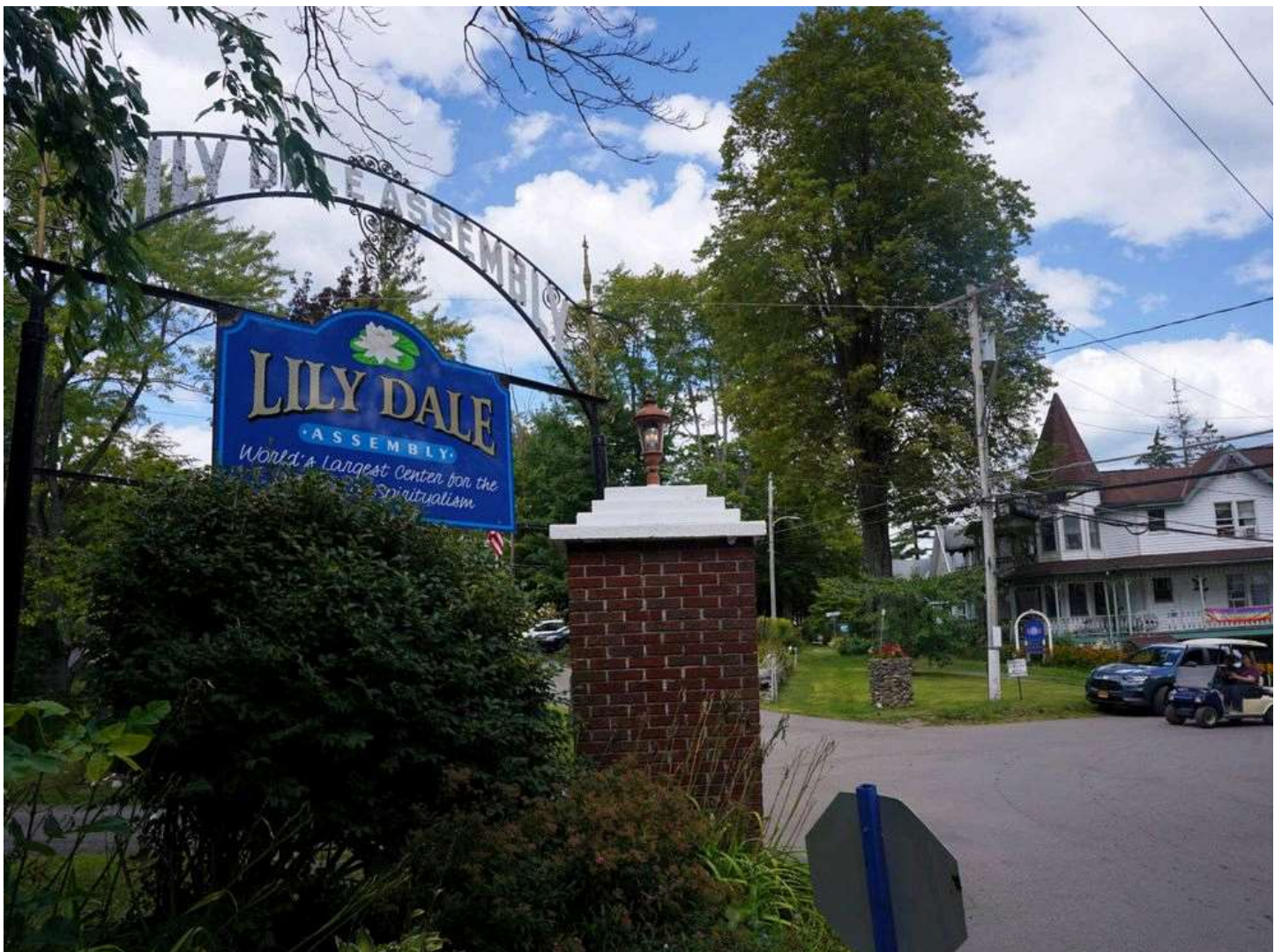
Puerta de entrada a Lily Dale.

Este singular pueblo habitado casi íntegramente por médiums ha cumplido 150 años batiendo récords de visitantes cada verano. Envuelta en varias polémicas, la comunidad espiritualista más grande del mundo representa un caso llamativo en EEUU