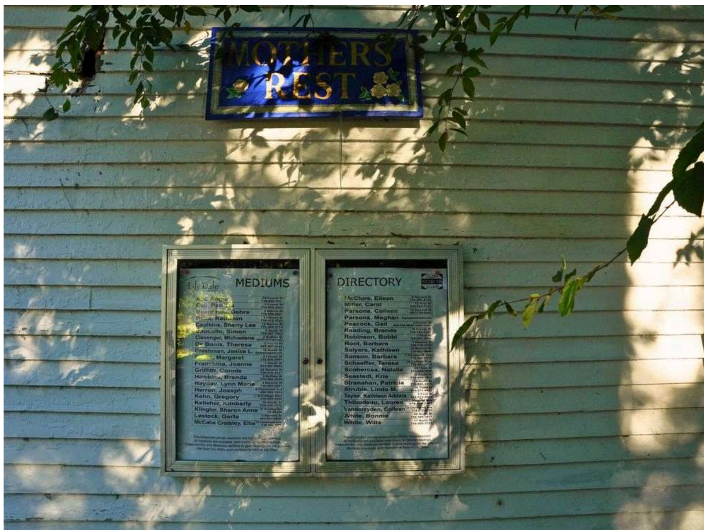
Listado de médiums.

Hoy, como en la época del Gran Despertar, América sigue redefiniendo su vida espiritual . Recientemente la administración Trump ha dado muestras de que reforzar sus vínculos con el electorado cristiano. El propio presidente se declaró "más religioso" después de sobrevivir a su intento de asesinato, experiencia que calificó de "milagro". Además, el pasado mes de septiembre presentó su iniciativa " America Prays ", destinada a fomentar la oración en las escuelas y en otros sitios públicos, e insistió en que su administración priorizaría la protección de las libertades religiosas. Y sin embargo las políticas presidenciales parecen chocar con los datos. Según un estudio reciente, el interés por la religión en Estados Unidos ha descendido en los últimos cinco años y el cristianismo retrocede frente a confesiones minoritarias .